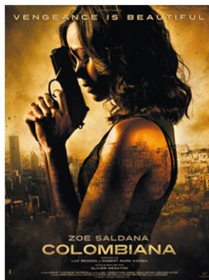
卡特利亚，幼时的花伤——评《致命黑兰》